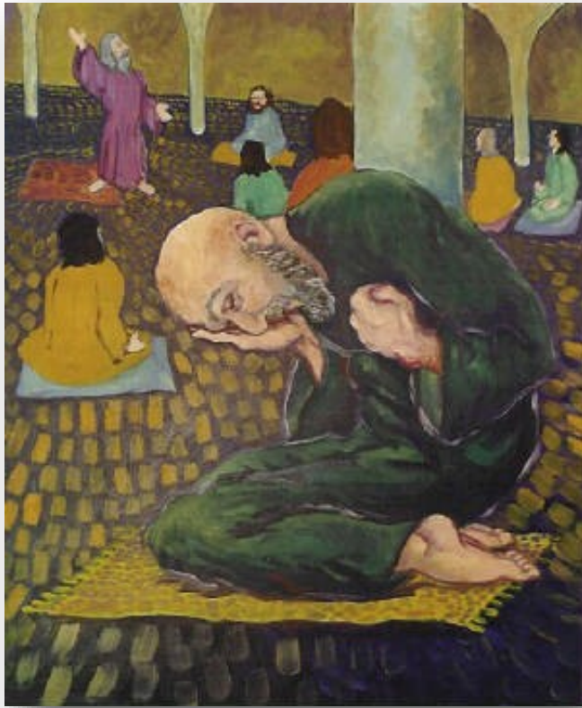
THE TAX-COLLECTOR & THE PHARISEE