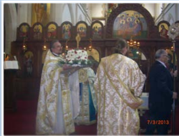
Στιγμιότυπα από τον εορτασμό της Σταυροπροσκυνήσεως, προεξέρχοντας του Σεβ. Αρχιεπισκόπου Θυατείρων & Μ. Βρετανίας κ. Γρηγορίου, από το γεύμα που ακολούθησε μετά τη Λειτουργία, από την Κυριακή των Βαΐων και την Μ. Παρασκευή